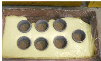
InstaGrout s'écoule et entre en expansion au bout de 20 minutes.

InstaGrout est conçu avec un temps de prise suffisamment lent pour permettre au matériau de s'écouler dans la zone ciblée. À mesure que la surface est recouverte, le matériau se dilate jusqu'à atteindre sa forme réticulaire durable définitive. Il s'écoule naturellement dans les espaces réduits sans nécessiter de talochage.