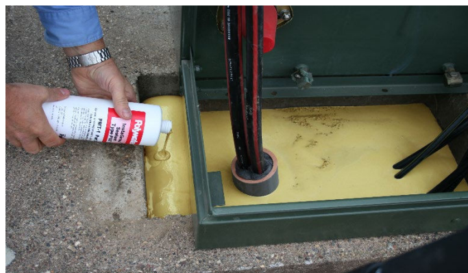
InstaGrout répare et crée une barrière protectrice pour les socles de baies.