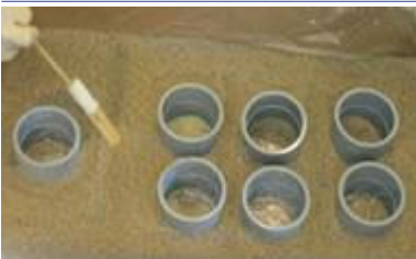
Cree canales superficiales para dirigir el flujo