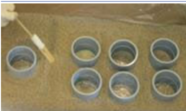
Créer des canaux peu profonds pour diriger le débit