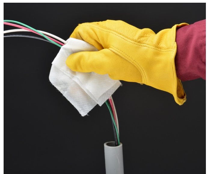
Application par étalement avec les lingettes Polywater SPY-D20

La boîte de lingettes Polywater SPY (SPY-D20) est un moyen pratique d'appliquer le lubrifiant lors des tirages sur de plus courtes distances. Chaque lingette permet d'enduire et de lubrifier 15 à 30 mètres de câble. Utiliser des lingettes supplémentaires si nécessaire en cas de tirages plus longs, plus larges ou plus difficiles. Un revêtement léger de Polywater SPY facilite le poussage ou le tirage des câbles.