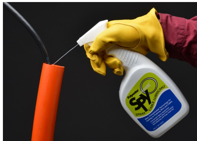
Il est possible de pulvériser Polywater SPY directement dans les conduits ou sur les câbles.

Il est possible d'obtenir les données relatives au coefficient de friction sur des gaines de câbles ou conduits supplémentaires ou spécifiques auprès d'American Polywater Corporation.