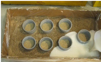
PedFloor wird gemischt und gegossen

PedFloor ist einfach aufzubringen. Es fließt in den vorgesehenen Bereich und dehnt sich in die Hohlräume aus.