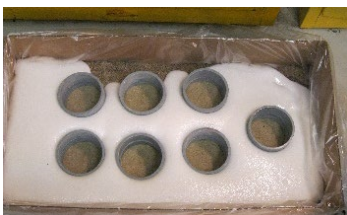
PedFloor fließt und dehnt sich nach 20 Minuten aus

PedFloor wurde mit einer Zeitverzögerung entwickelt, damit das Material durch den gesamten Anwendungsbereich fließen kann. Wenn die Oberfläche abgedeckt wird, dehnt es sich aus und wird zu seiner endgültigen, dauerhaften Form vernetzt. Es fließt von alleine in kleine Hohlräume und muss nicht aufgespachtelt werden.