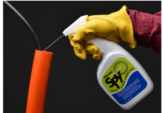
Polywater Spy kann direkt in Rohre oder auf Kabel gesprüht werden

Daten zum Reibungskoeffizienten anderer oder spezieller Kabelmängel sind von Polywater erhältlich.