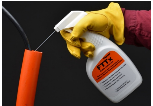
Polywater FTTx kann in kleine Rohre gesprüht werden

Erfüllt die Modellspezifikation MS-5/20xx für HDPE-Massivwandrohre für Leistungs- und Kommunikationsanwendungen.