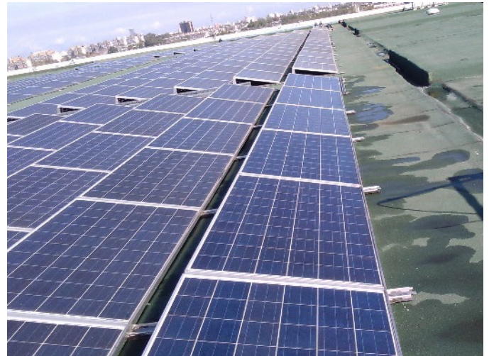
Der Solarmodulreiniger von Polywater ist sicher für Anwender und Umwelt.

Weitere Informationen finden Sie im Whitepaper zum Thema Wassersparen des Solarmodulreinigers .