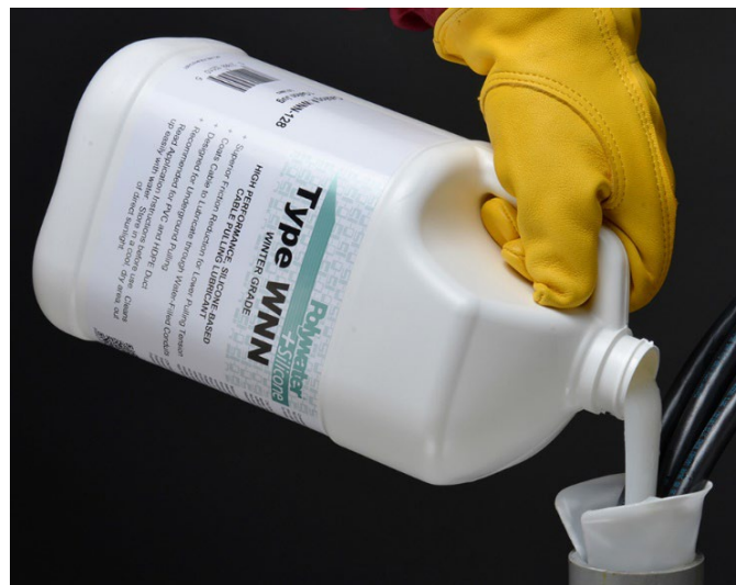
Polywater + Silicone-Schmiermittel lässt sich leicht pumpen oder in das Rohr gießen

Daten zum Reibungskoeffizienten anderer oder spezieller Kabelmängel sind von Polywater erhältlich.