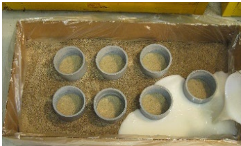
PedFloor wird gemischt und gegossen

PedFloor ist einfach aufzubringen. Es fließt in den vorgesehenen Bereich und dehnt sich in die Hohlräume aus.