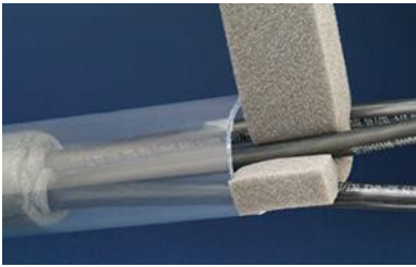
Separe los cables con espuma