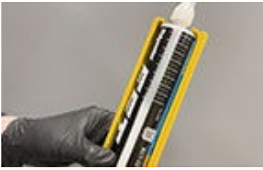
Marca en el lateral del cartucho