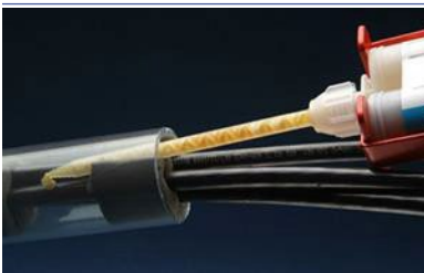
Dispense sellador de espuma