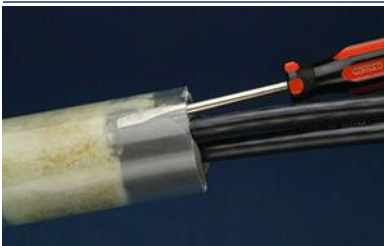
Use un destornillador para revisar si hay espacios vacíos

El mezclador estático se puede reutilizar 7-10 minutos después de la inyección.