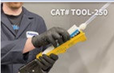
TOOL-250 con FST-250

Sostenga el cartucho de forma vertical; quite el tapón de rosca. (El tapón se puede guardar para reutilizar el cartucho.) Coloque el mezclador estático y ajústelo en el lugar.