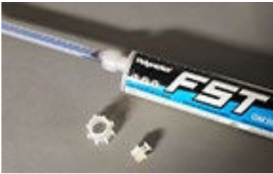
Prepare el cartucho