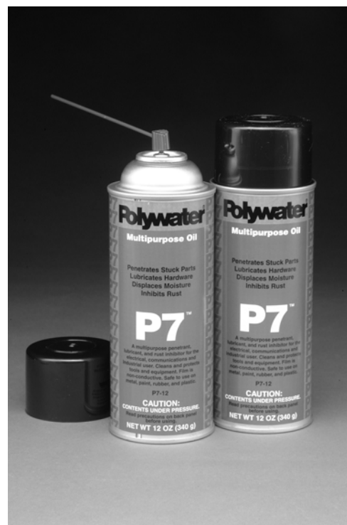
El Aceite Multi-Uso P7™ Aerosol (cat. # P7-12) penetra grietas apretadas y suelta componentes atorados.